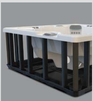
Polymer-Rahmen & Bodenwanne