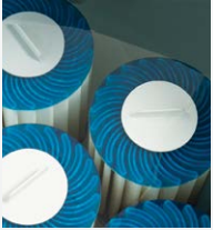
100% Filterung SilentFlo Umwälzung